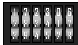
Código temporal-Código único o de periodo programable