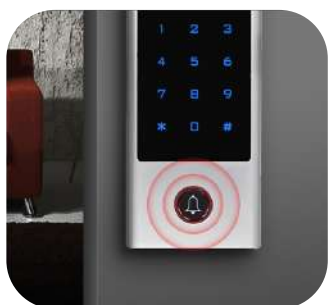
Aviso de llamada por timbre