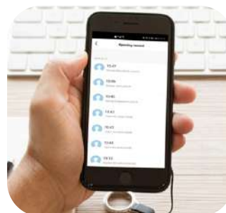
Historial de aperturas