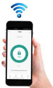
Apertura remota donde sea, soporta 3G/4G/5G