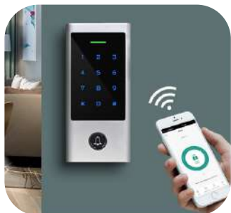
Red Wi-fi 2.4G App móvil de intercomunicador Nombre de la app: TuyaSmart o Smartlife

El H1-WIFI es un controlador de acceso RFID con teclado touch y resistente al agua. Está integrado con la app Tuya que soporta 500 usuario móviles y 1,000 usuarios comunes (incluyendo usuarios de tarjeta/PIN). La App está disponibles para IOS y Android.